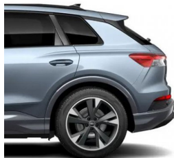
Geyser Blue Metallic 5Y5Y