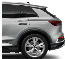
Typhoon Grey Metallic -2L2L