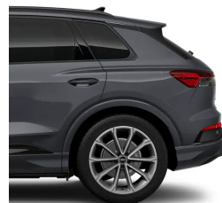
Pebble Grey C2C2