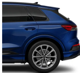
Navarra Blue Metallic 2D2D