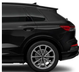
Mythos Black Metallic -0E0E