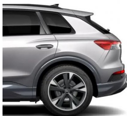
Floret Silver Metallic L5L5