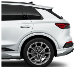
Glacier White Metallic -2Y2Y