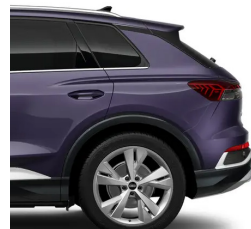
Aurora Violet -J6J6