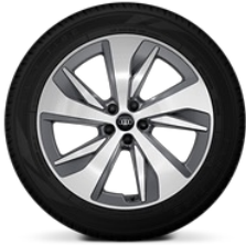
20" álfelgur - 5 arma Aero ring, grafitgráar Staðalbúnaður Advanced (42H)