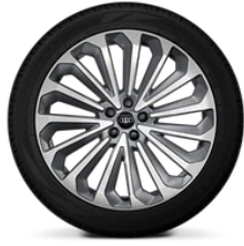
21" álfelgur - 15 arma, grafitgráar Hluti af Advanced Plús pakka (F49)