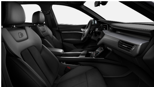
S-line sæti (Ath. rauðir saumar koma aðeins í Edition S-line)