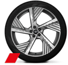
22" álfelgur - Audi Sport, 5-arma structure style, Titanium gráar, diamond-turned 300.000 fyrir S-line og Edition S (54L)