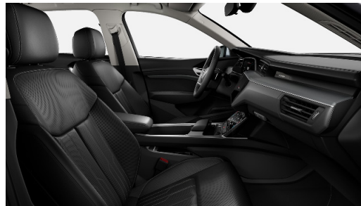
Individual Contour framsæti, Valcona leður, kæling og nudd (PS8, 4D8, N5D) Hiti í aftursætum og fjögurra svæða tölvustýrð miðstöð (4A4 9AQ)