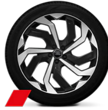
21" álfelgur - Audi sport 10 arma "rotor" Staðalbúnaður S-line (42P)