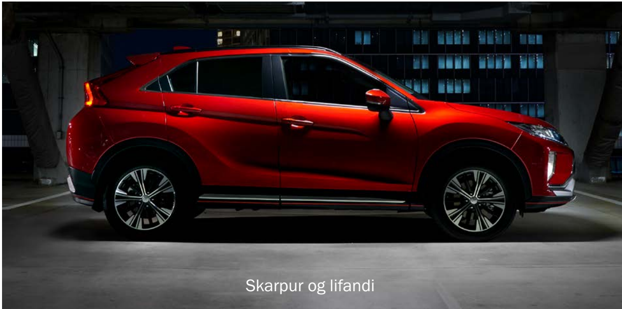
Skarpur og lifandi