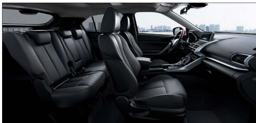
Rúmgott farþegarymi og stækkanlegt farangursrymi.