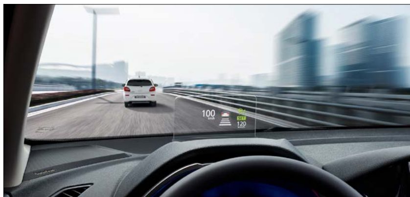
Framrúðuskjár sem sýnir hraða o.fl. (HUD: Head Up Display).