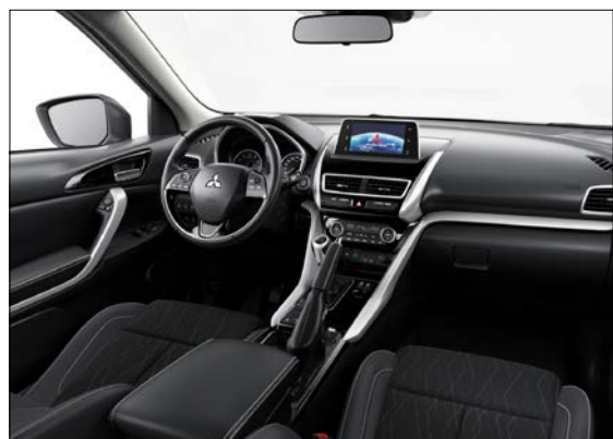
Smartlink margmiðlunartæki með tengingu fyrir Android Auto og Apple CarPlay.