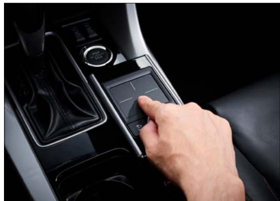
Snertiflötur fyrir margmiðlunartæki (Touch Pad).