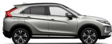
Sterling Silver (U25)