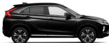
Amethyst Black (X42)