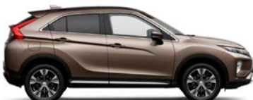
Bronze Metallic (C21)