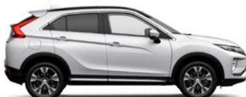
Silky White (W13)