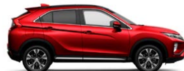
New Red (P62)