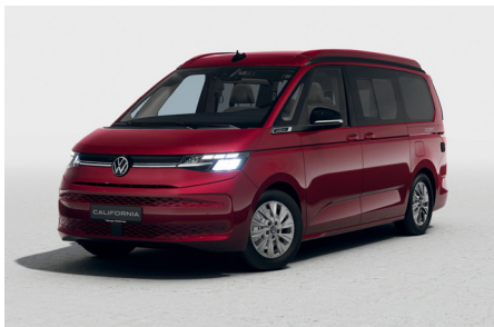
Fortana Red Metallic