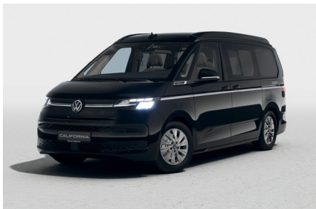
Deep Black Pearlescent