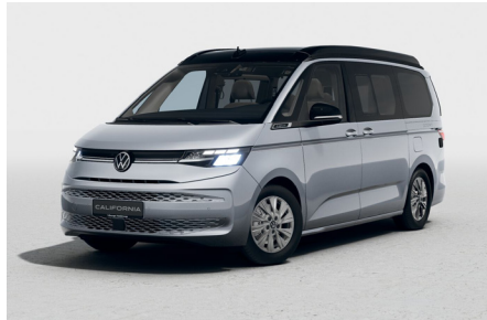
Mono Silver Metallic