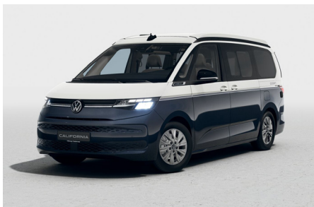
Candy White / Starlight Blue Metallic