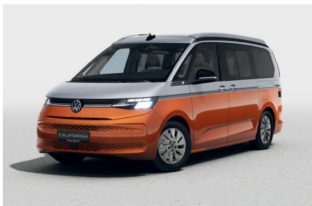
Mono Silver Metallic / Energetic Orange Metallic