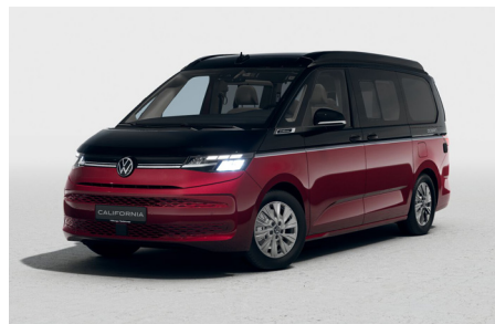
Deep Black Pearlescent / Fortana Red Metallic