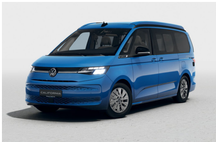
Medium Blue Metallic