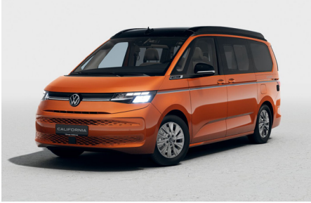
Energetic Orange Metallic