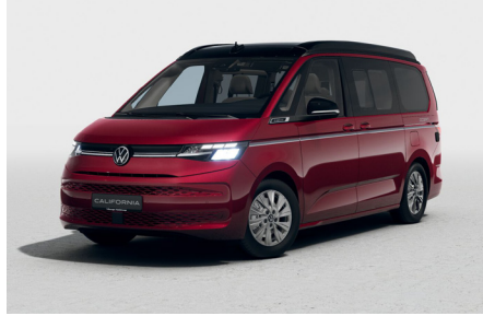
Fortana Red Metallic