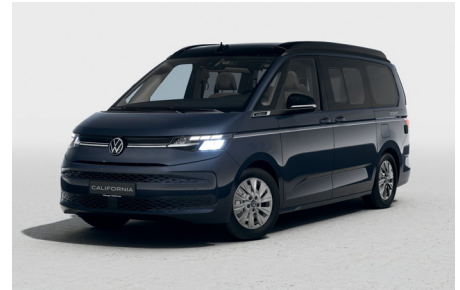
Starlight Blue Metallic