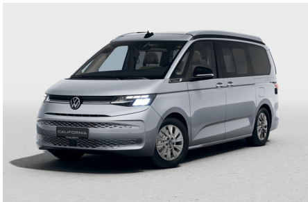
Mono Silver Metallic