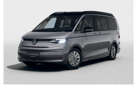
Reflex Silver Metallic