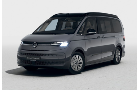
Indium Grey Metallic