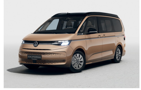
Copper Bronze Metallic