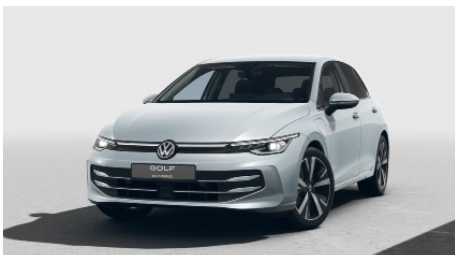
Oyster Silver Metallic