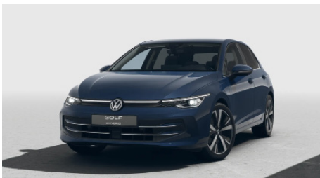
Anemone blue metallic