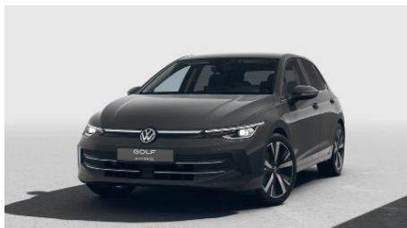
Dolphin Gray Metallic