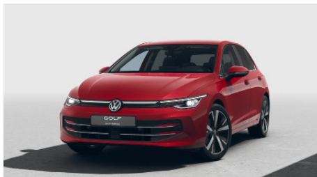
Kings Red Metallic