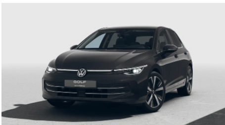
Grenadilla Black Metallic