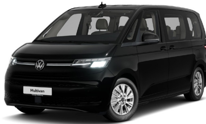
Deep Black Pearl