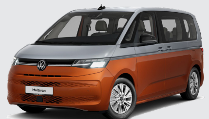
Monosilver Metallic Energetic Orange Metallic (300.000 kr.)