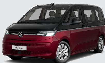
Deep Black Pearl Effect Fortana Red Metallic (300.000 kr.)