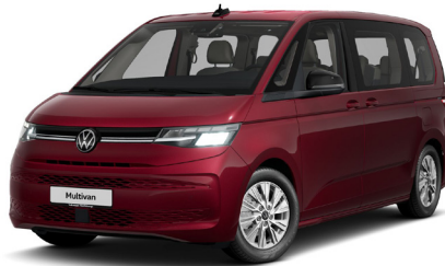
Fortana Red Metallic