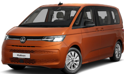
Energetic Orange Metallic