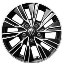
Dundrod 17" svartar og silfur