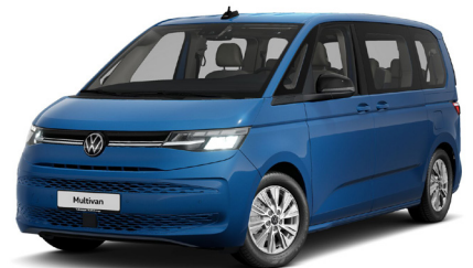
Medium Blue Metallic