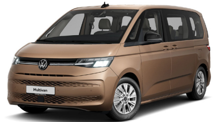
Copper Bronze Metallic