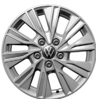
Dundrod 17" silfur