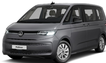
Indium Gray Metallic