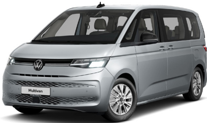
Reflex Silver Metallic