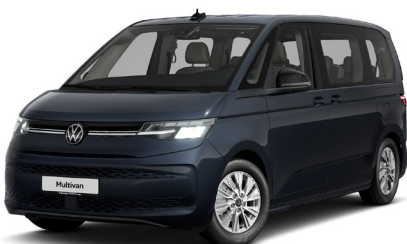
Starlight Blue Metallic